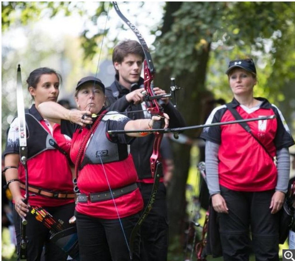
Vice-championnes de France (derrière Saint-Avertin), les Montlousiennes viseront de nouveau le podium à la maison.