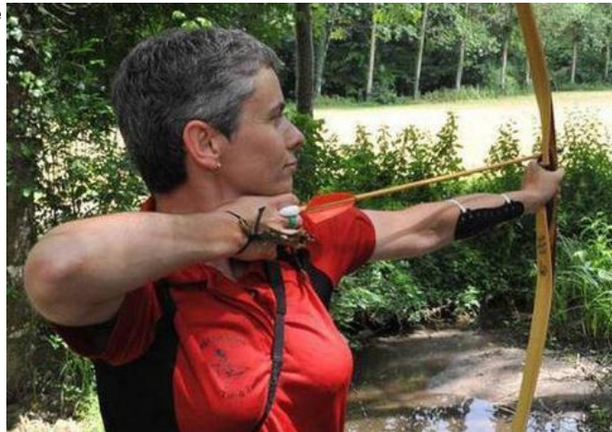
Eve Gemarin et Montlouis courent après un doublé.