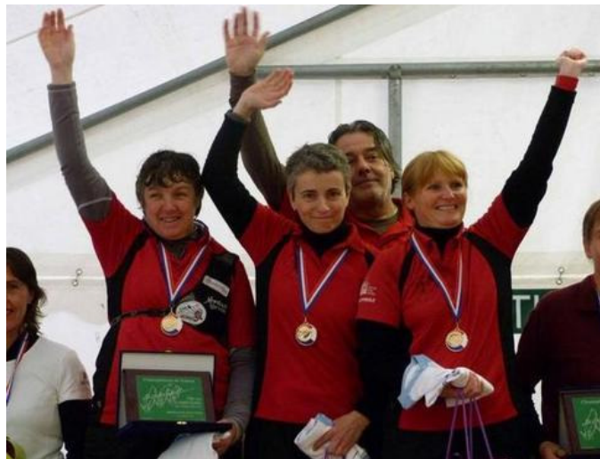
Déjà sacré en 3D, les Montlouiennes ont décroché le titre de tir en campagne ! - (Photos cor. NR, Léo Schmitt)